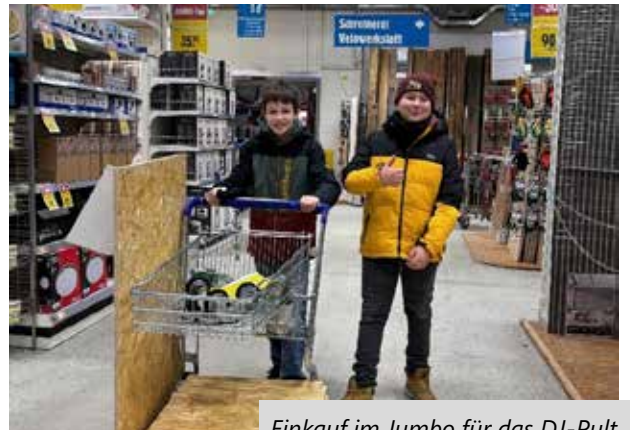
Einkauf im Jumbo für das DJ-Pult

Ich freue mich auf alles, was 2026 noch bereithält.