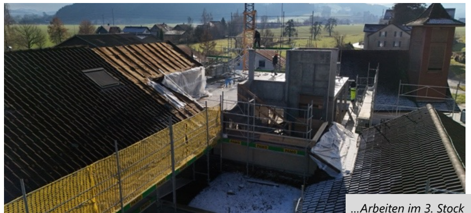
...Arbeiten im 3. Stock