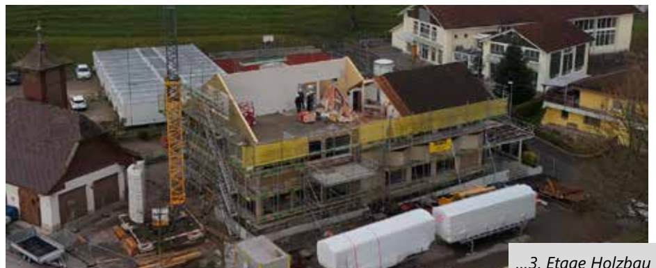
...3. Etage Holzbau