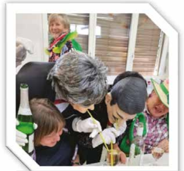
Bild aus der Fotogalerie 2025 Ein Anlass, welches im Jahr 2025 alle Fasnächtler oder Besucher angesprochen hat