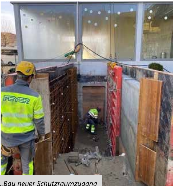
...Bau neuer Schutzraumzugang