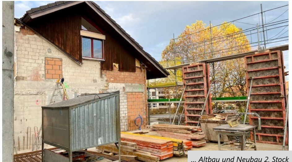
... Altbau und Neubau 2. Stock