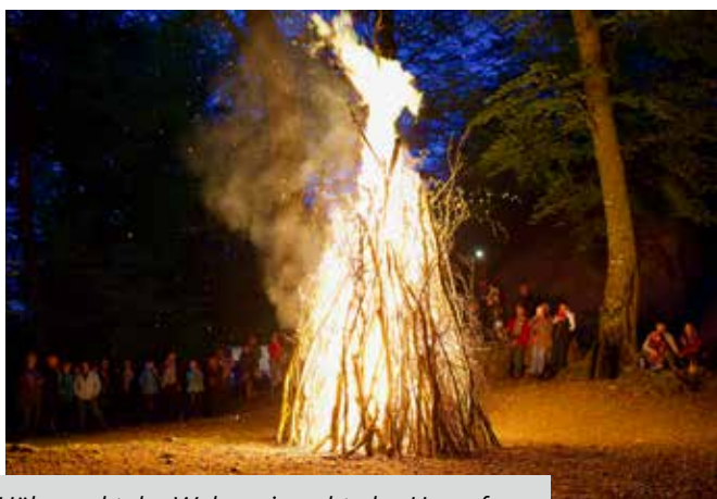
Höhepunkt der Walpurgisnacht: das Hexenfeuer

Es war eine andächtige Stimmung, die am späten Dienstagabend auf dem Kastelenhügel in Alberswil herrschte. Als um 21.30 Uhr das grosse Feuer entzündet wurde, versammelten sich rund 200 Personen, um gemeinsam das Ritual der Walpurgisnacht zu feiern. Nach wenigen Minuten schossen die Flammen meterhoch in den wolkenlosen Nachthimmel und erleuchteten den Burghügel, während ein Es-Horn-Spieler für die musikalische Untermalung sorgte. Auch die eine oder andere kleine Hexe wurde auf der Kastelen gesichtet.