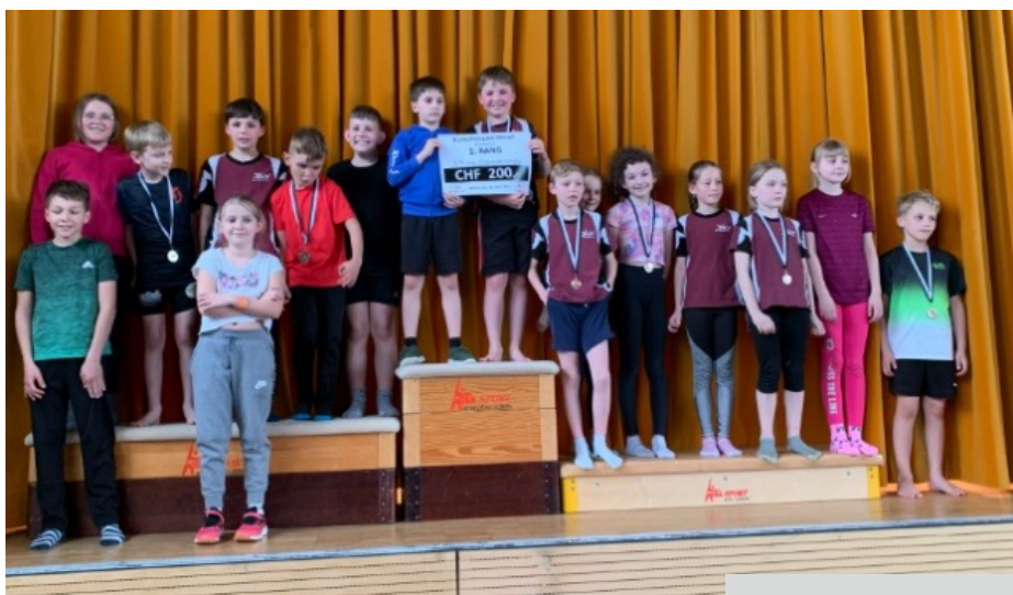
Klasse 3. Primar Ettiswil