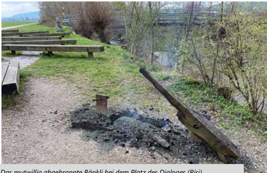
Das mutwillig abgebrannte Bänkli bei dem Platz des Dialoges (Risi)