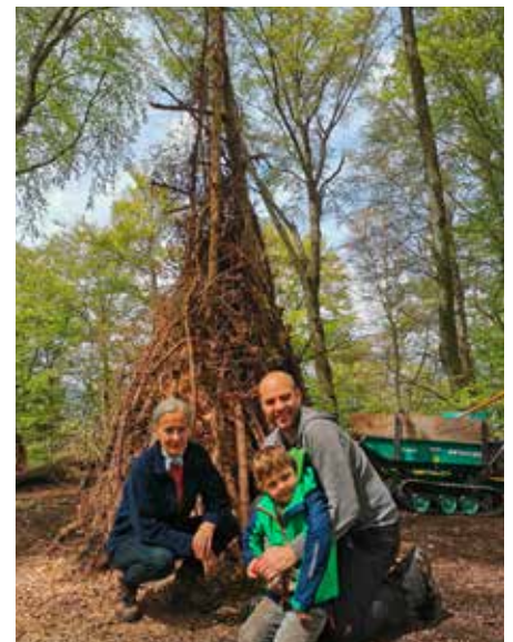
Am Mitwirkungstag wurde das Hexenfeuer fachmännisch vorbereitet

Infrastruktur unterstützen: Bitte melden Sie Besuche von grösseren Gruppen im Voraus über eine Mail an info@kastelen.ch an. Auf dem Gelände gibt es keine Kehrriechkübel, tragen Sie Ihren Abfall wieder zum Ausgangsort zurück. Und halten Sie Sorge zu den To-