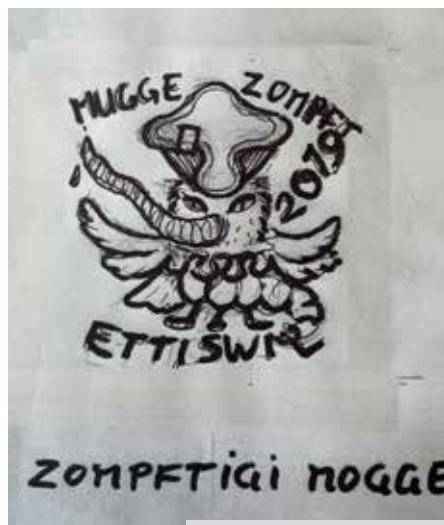
Eingereichtes Sujet 2019

Als einzige Vorgabe gelten die Worte "MUGGEZUNFT ETTISWIL", die Jahreszahl "2024" sowie unsere Mücke als Erkennungszeichen. Ansonsten sind Deiner Fantasie keine Grenzen gesetzt.