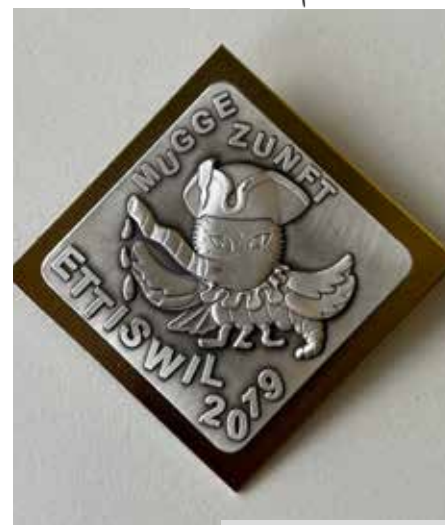
Fertige Plakette 2019

Die Ansteckversion wird in einer Auflage von ca. 1000stk geprägt. Sie gilt als Eintritt zu unserem grossen Umzug vom Sonntag 11. Februar 2024.