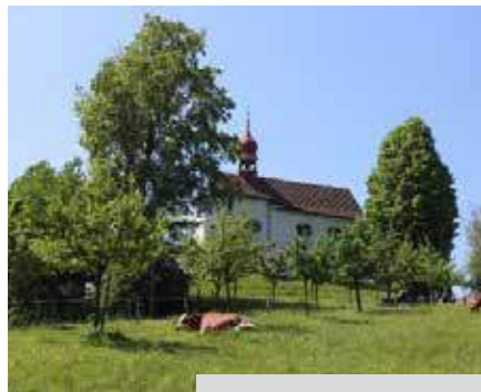
Bläsi-Kapelle im Burgrain

Die im Jahresprogramm publizierten Anlässe finden im Monat Juni leider nicht statt!