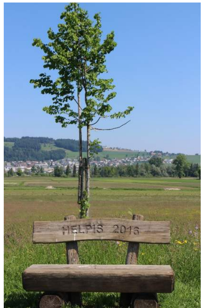
Die Bank HELPIS 2016 wurde zur Gründung der Jugendgruppe HELP des Samaritervereins von beiden Frauenvereinen als Dank gespendet.

Leider findet bis zum jetzigen Zeitpunkt kein Gottesdienst statt. Ob die Bläsimesse im August und die Herbstwallfahrt im September stattfinden können ist noch offen. Wir halten Sie auf dem Laufenden.